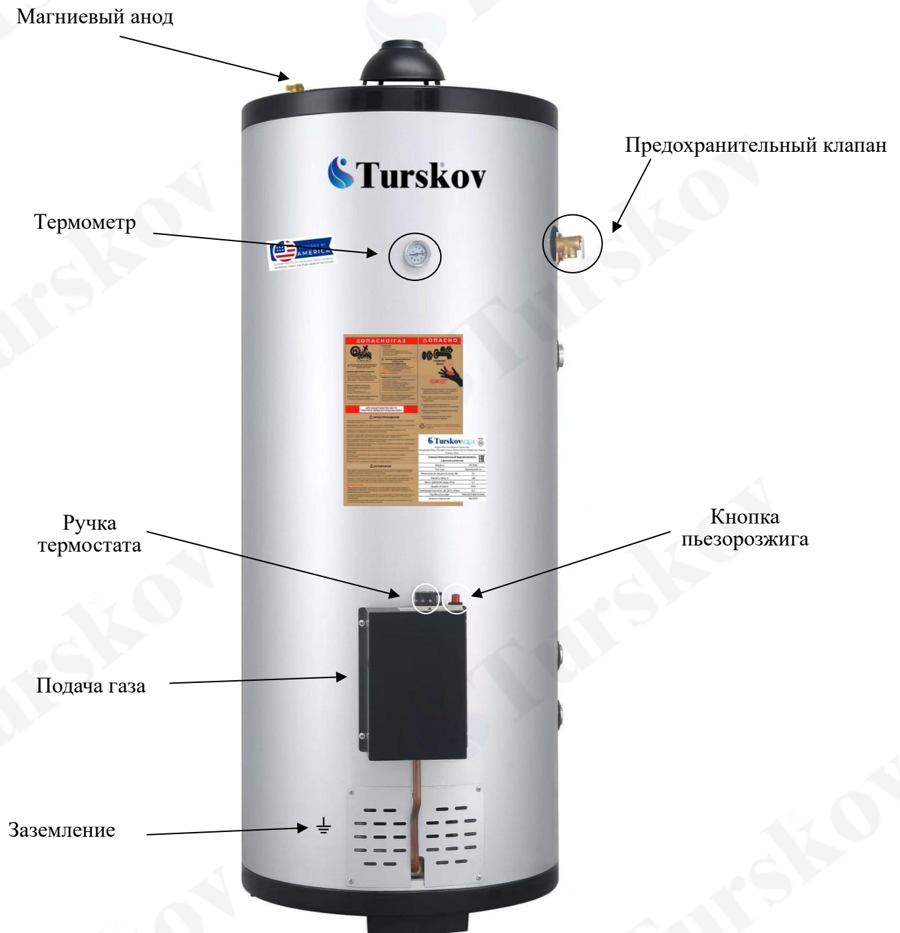
Схема 1. Общий вид